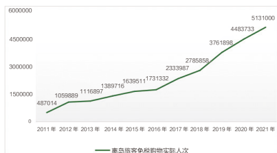
图2 离岛免税购物人次趋势图

离岛免税购物旅客人次。自2012年以来，海南离岛免税购物旅客人次呈上升趋势，增长相对稳定，如图2所示。2011年4月至12月海南省离岛免税购物旅客约48.7万人次。海南离岛免税购物经历了10年的发展，免税额度及开放水平也在逐步放宽，政策实施不断完善，截至2021年9月，海南省离岛免税购物旅客就已达513.1万人次，是2011年海南试行离岛免税政策时人数的十倍以上，足以体现离岛免税购物政策对海南旅游产业极大的拉动作用。